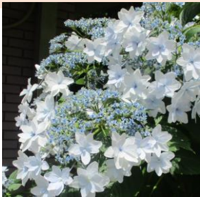
紫陽花 すみだの花火