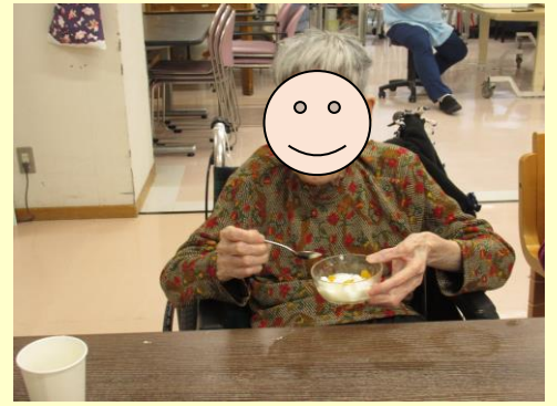
料理クラブ 杏仁豆腐