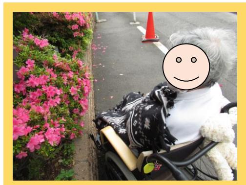
お散歩クラブ 弁公園へお散歩

発行者 社会福祉法人 恩賜財団慶福育児会 特別養護老人ホーム 麻布慶福苑 〒106-0047 東京都港区南麻布5-1-20 Tel 03-3446-5501 http://www.azabukeihukuen.com