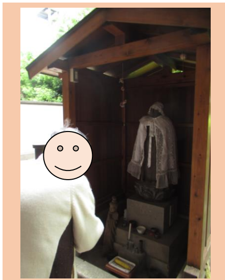
お散歩クラブ お散歩途中にあるお地藏様にお参り 実は慶福苑の横に由緒あるお地藏さまがいらっやいます。毎年6月9日にお地藏祭をおこない供養しています。