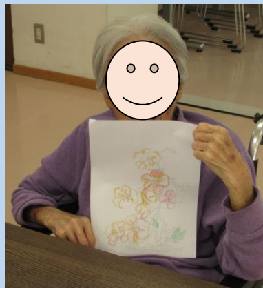
塗り絵クラブ 作品発表